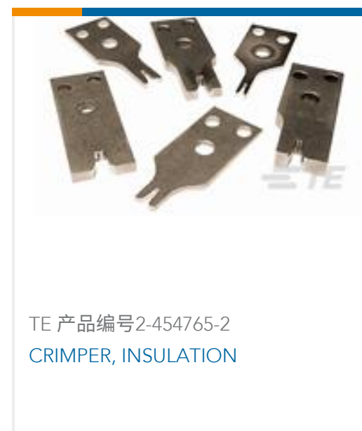
TE 产品编号2-454765-2 CRIMPER, INSULATION