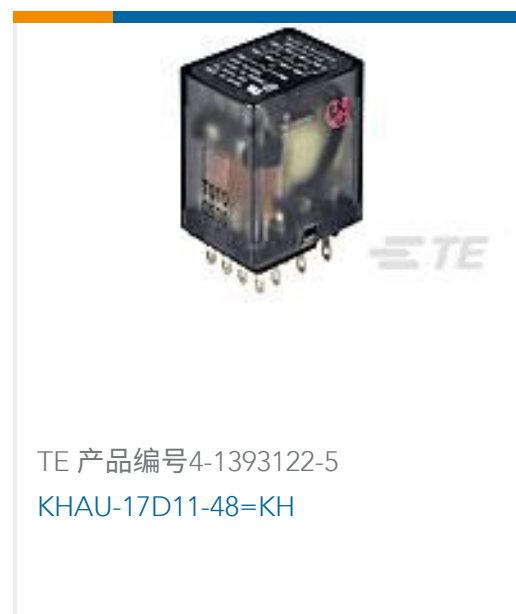
TE 产品编号4-1393122-5 KHAU-17D11-48=KH