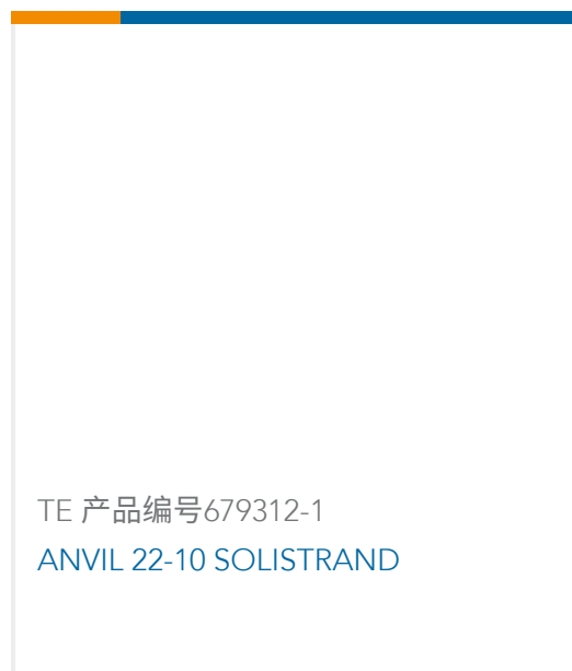
TE 产品编号679312-1 ANVIL 22-10 SOLISTRAND