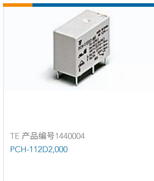
TE 产品编号1440004 PCH-112D2,000